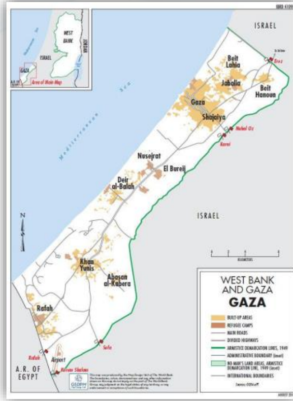
شكل 1 خارطة عامة لغزة