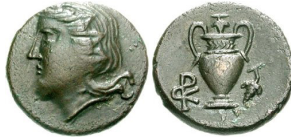
(شكل رقم 63)

https://www.cng-coins.com/Coin.aspx?CoinID=114562