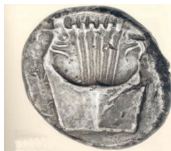
(شكل رقم 59)

http://www.ancientlyre.com/the_biblical_kinnor