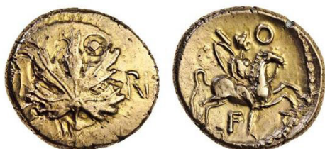
(شكل رقم 25)

https://www.the-sale-room.com/en-gb/auction-catalogues/spink/catalogue-id-srspi10053/lot-9e959554-3881-427c-9b4a-a4bf00bbb61d