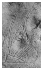
(شكل رقم 58)

http://www.ancientlyre.com/historical_research