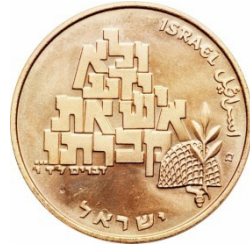
( شكل رقم 47 )

https://colnect.com/he/coins/coin/15999-100_Lirot_21st_Anniversary_of_Independence-1958~1980_-_D7%99%D7%9E%D7%99_%D7%A2%D7%A6%D7%9E%D7%90%D7%95%D7%AA%D7%99%D7%A9%D7%A8%D7%90%D7%9C