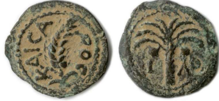
(شكل رقم 31)

http://www.wildwinds.com/coins/greece/judaea/marcus_ambibulus/i.html