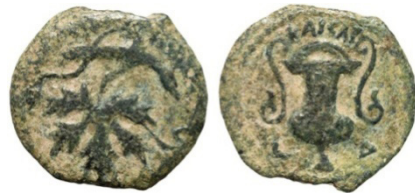
(شكل رقم 67)

https://www.vcoins.com/en/stores/apollo_numismatics/12/product/judaea_valerius_gratus_roman_prefect_under_tiberius_ae_prutah_vine_leafkantharos/592462/Default.aspx