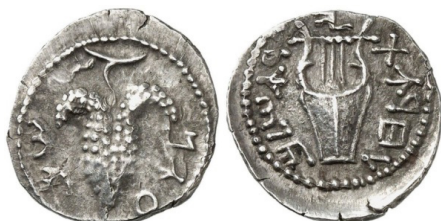
(شكل رقم 14)