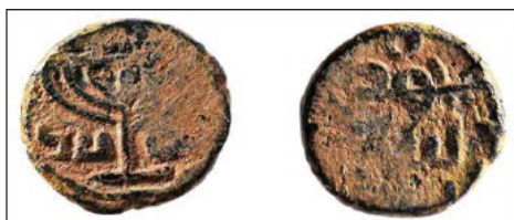
(شكل رقم 44)

https://www.pressreader.com/usa/the-jewish-voice/20171215/281861528851477