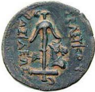
(شكل رقم 2)

https://www.google.ps/search?biw=1366&bih=637&tbm=isch&sa=1&ei=pfGjWu7UJcGOsgGwtKDYBg&q=Seleukos+II+coins+anchor+&oq=Seleukos+II+coins+anchor+&gs_l=psy-ab.3...190539.192062.0.196133.9.9.0.0.0.263.1079.0j2j3.5.0...0...1c.1.64.psy-ab..6.0.0...0.dX6mfMNqxn8#imgrc=H55beykC:BENopM