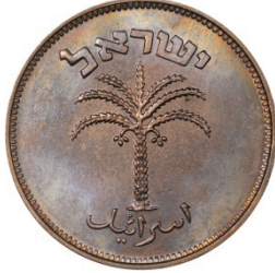
(شكل رقم 30)

https://www.ngccoin.com/price-guide/world/israel-100-pruta-km-14-5709-1949-5715-1955-cuid-1201471-duid-1473050