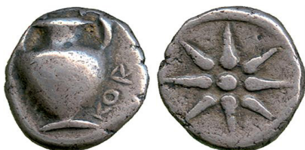
( شكل رقم 52 )

https://www.pinterest.com/pin/473792823283417656