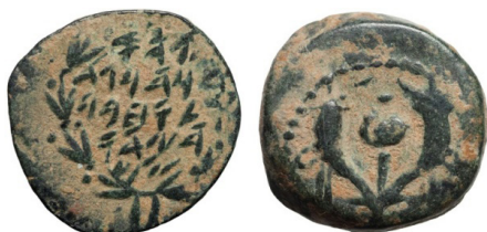
(شكل رقم 26)