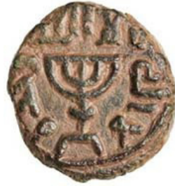
( شكل رقم 45 )

http://www.coinsweekly.com/en/Archive/New-Exhibition-of-the-ANS-at-the-Fed-Coins-of-the-Holy-Land/8?&id=600&type=n