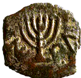
(شكل رقم 43)

https://commons.wikimedia.org/wiki/File:Ancient_Menorah_Coin.gif