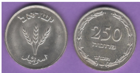
(شكل رقم 34)