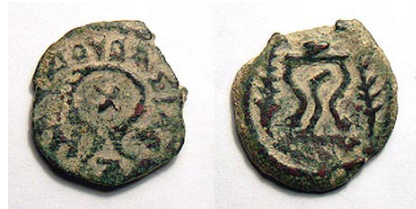
(شكل رقم 1)

http://www.wildwinds.com/coins/greece/judaea/herod_I/AJCII_236-8.jpg