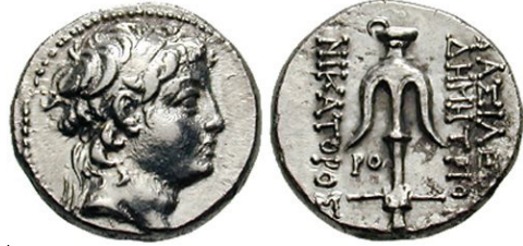
(شكل رقم 11)

http://www.wildwinds.com/coins/greece/seleucia/demetrios_II/Houghton_0567.jpg