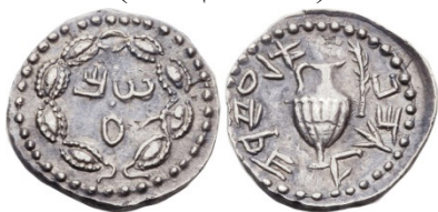
(شكل رقم 16)

https://www.numisbids.com/n.php?p=lot&sid=796&lot=23058