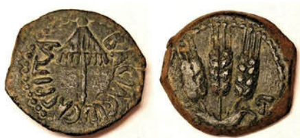
(شكل رقم 36)

http://www.ancientcoinage.org/coins-of-the-herodians--roman-procurators.html