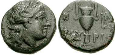
(شكل رقم 62)

https://www.cng-coins.com/Coin.aspx?CoinID=51480