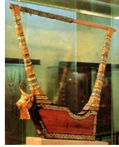
(شكل رقم 61)

https://www.cng-coins.com/Coin.aspx?CoinID=51480