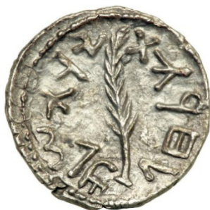
(شكل رقم 20)

http://www.icollector.com/Ancient-Jewish-Coinage-Bar-Kokhba-War-132-135-CE-AR-Denar-Zuz-2-98-g-attributed-to-year-3-134_i9764420