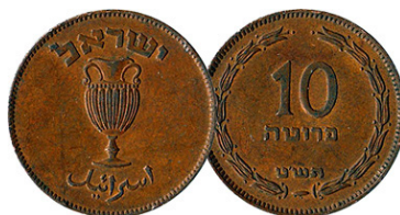
(شكل رقم 15)

http://coinquest.com/cgi-bin/cq/coins?main_coin=11440