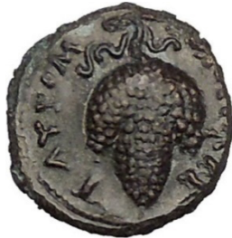
(شكل رقم 68)

/https://www.ebay.com/itm/TAUROMENION-in-SICILY-305BC-Apollo-Grapes-RA-RE-R2-Ancient-Greek-Coin-i51604-/351473671968