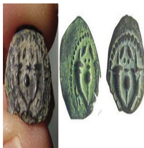
(شكل رقم 41)

https://sites.google.com/site/terryolmsted/index-6/chapter-262/judea