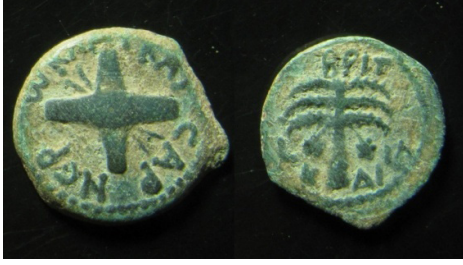
(شكل رقم 32)

https://www.vcoins.com/en/stores/shick_coins/202/product/judaea_antonius_felix_procurator_ae_prutah_year_14_54_ad_full_legend/549416/Default.aspx