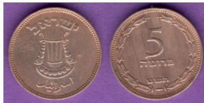
(شكل رقم 13)

http://swapmeetdave.com/Coins/Israel/KM10-1949.jpg