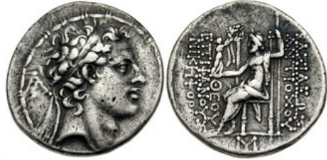
(شكل رقم 29)

http://www.wildwinds.com/coins/greece/seleucia/antiochos_IV/BMC_21.jpg