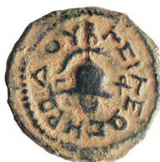
( شكل رقم 51 )

http://www.jewishvirtual-library.org/herod-the-great-s-coins