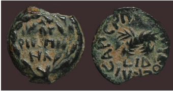
(شكل رقم 64)

http://www.akropolis-coins.com/page5.html