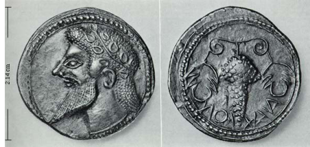
(شكل رقم 65)

https://hogshead-wine.files.wordpress.com/2011/04/sicily_naxos_drachm_525_510bc.jpg