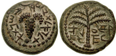
(شكل رقم 6)

https://www.ngccoin.com/news/article/2494/The-Coinage-of-Bar-Kokhba/#group-6