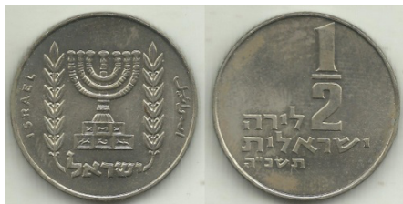
(شكل رقم 42)

http://swapmeetdave.com/Coins/Israel/KM36-1-1965.jpg