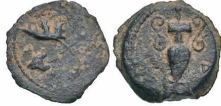
(شكل رقم 17)

https://www.coin-archives.com/18f306b37df2a750741d0645fb9751cf/img/agora/57/image00078.jpg