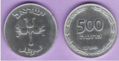
(شكل رقم 38)

http://www.swapmeetdave.com/Coins/Israel/KM16-1949.jpg