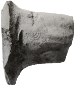
( شكل رقم 46 )

http://segulamag.com/en/news/whats-jewish-menorah-early-islamic-coins-vessels