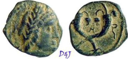
(شكل رقم 37)

http://www.wildwinds.com/coins/greece/arabia/nabataea/Meshorer_058.jpg