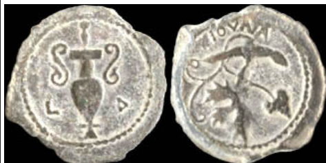
(شكل رقم 8)

http://www.fontanillecoins.com/archives_2012.htm