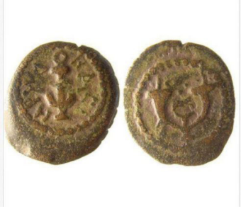
(شكل رقم 12)

https://www.google.ps/search?q=herod+the+great+coins+anchor&source=lm&s&tbm=isch&sa=X&ved=0ahUKEwiVjPqLnODZAhWDyaYKHV6LCOoQ_AUICigB&biw=1366&bih=588#imgcr=y4-dysVWa9T5xM