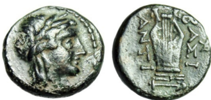
(شكل رقم 60)

https://www.ebay.com/itm/Antiochus-II-Theos-AE11-Apollo-BASIS-ANTI-Kithara-Lyre-Extremely-Rare-gVF-/183058270035