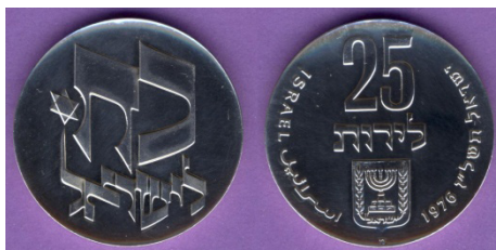
(شكل رقم 57)

http://swapmeetdave.com/Coins/Israel/KM85-1976-proof.jpg