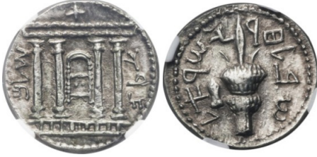
(شكل رقم 54)

http://www.numisbids.com/n.php?p=lot&sid=611&lot=23821